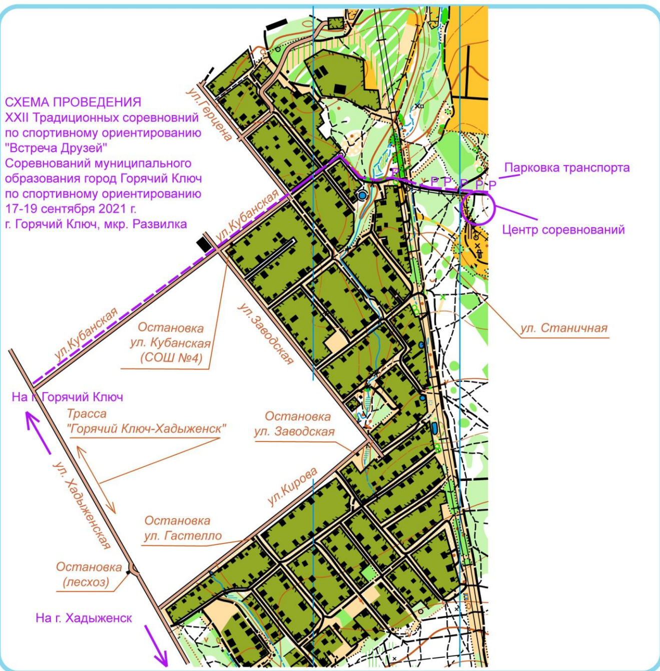
СХЕМА ПРОВЕДЕНИЯ XXII Традиционных соревнований по спортивному ориентированию "Встреча Друзей" Соревнований муниципального образования город Горячий Ключ по спортивному ориентированию 17-19 сентября 2021 г. г. Горячий Ключ, мкр. Развилка