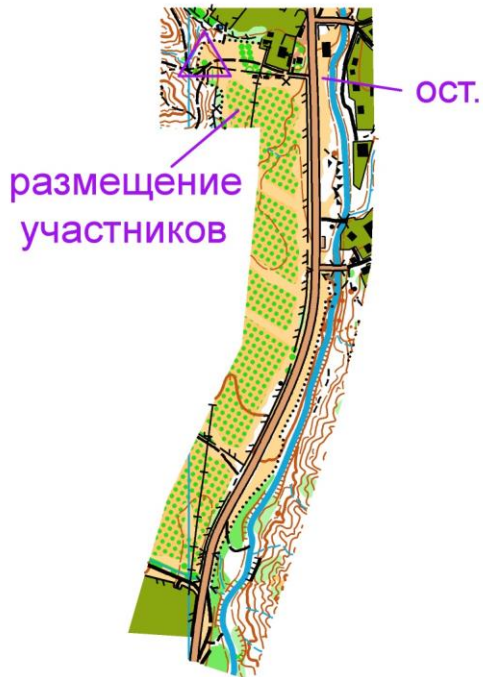
Схема старта и финиша 2 апреля