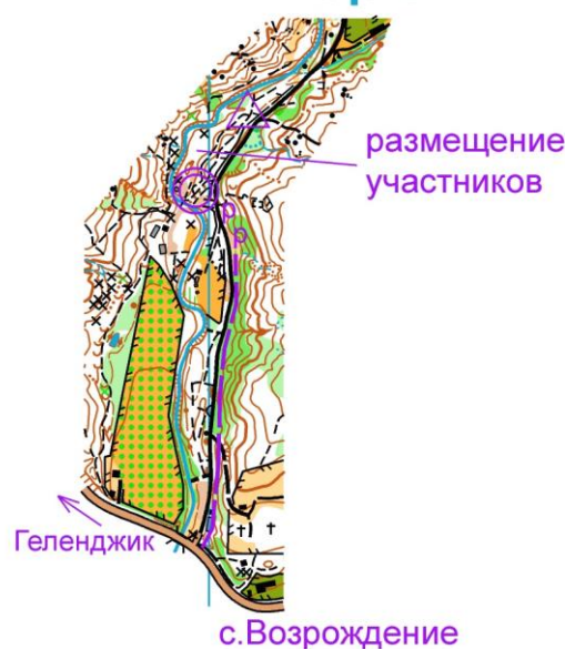
Схема старта и финиша 25 марта, 4 апреля