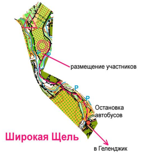
Схема старта и финиша 3 апреля