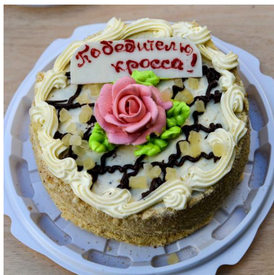
Памяти Ц.Л. Куникова – 2018

24 февраля 8.20 отъезд от старой АС (улица Ленина). Геленджик – Широкая щель (стоимость проезда 23 руб.). Время в пути – 25 мин.