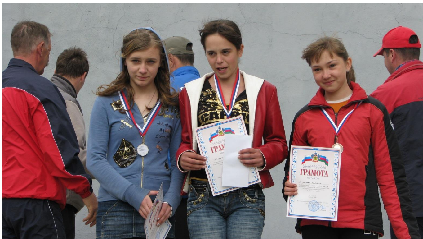
ФОТО 8. Заслуженные медали на краевых соревнованиях.