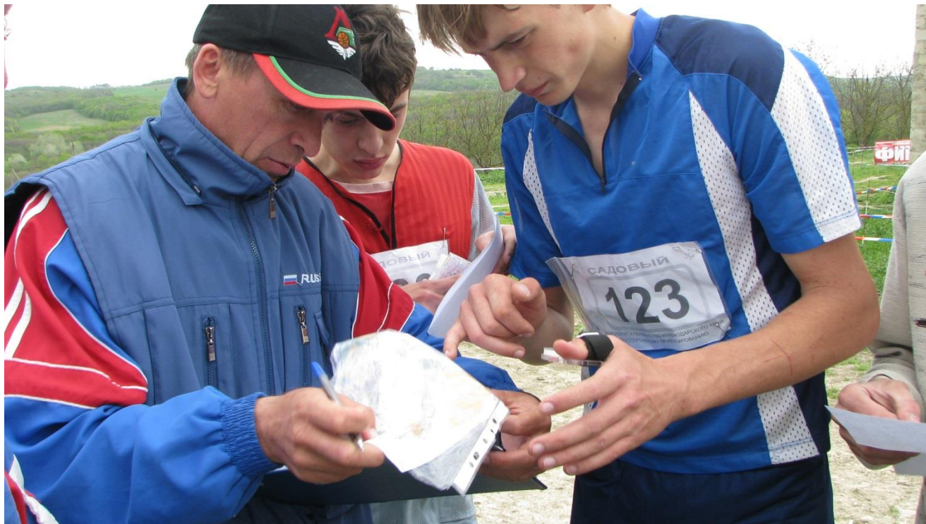
ФОТО 7. Разбор «полётов» после дистанции со своими учениками.

Но то, что наш УЧИТЕЛЬ привил любовь к самому замечательному лесному виду спорта – это его заслуга! Спасибо ему за это и низкий поклон!