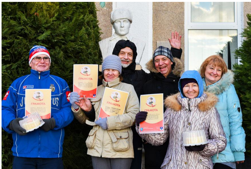
Памяти Ц.Л. Куникова – 2017

25 февраля 8.40, 9.20 отъезд от старой АС (улица Ленина). Геленджик – Адербиевка (стоимость проезда 30 руб.). Время в пути – 30 мин.