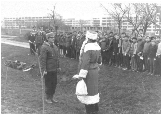
Декабрь. 1979 год. Фото. Первые соревнования на призы «Деда мороза».

Клуб располагался недалеко от 22 школы и основной контингент занимающихся детей были её учащиеся.