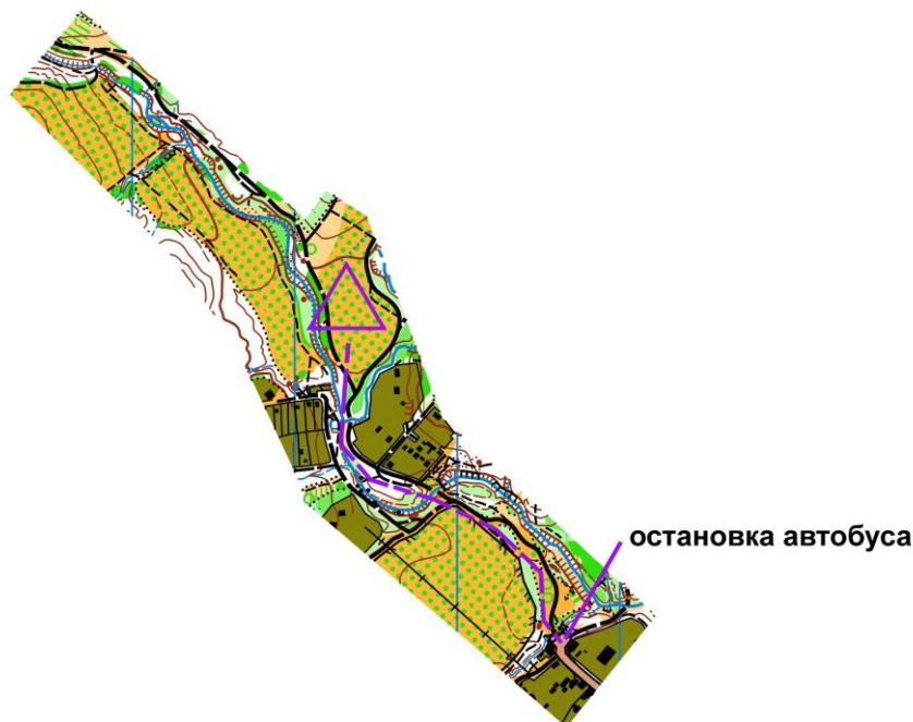
Схема старта 2 дня

Расписание автобусов Широкая щель - Геленджик: 13-00 16-10 18-40